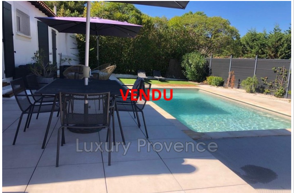
Maison 2569 Calas

VENDU CALAS- Proche du centre village et de toutes les commodités, à 5 minutes de la gare Aix TGV et des axes autoroutiers, dans un cadre champêtre tout en étant non isolé, au calme, belle villa contemporaine T4 de 110m 2 de plain pied sur une parcelle de 538m 2 . Vous ne pouvez être que séduit par cette maison entièrement rénovée avec des matériaux de qualité et beaucoup de goût! Hall d'accueil à l'entrée pour poser vos vestes et chaussures, grande pièce de vie de 50m 2 avec cuisine ouverte, le tout baigné de lumière, et une cheminée insert pour réchauffer vos soirées d'hiver. Dans la partie nuit, grande suite parentale avec dressing, 2 chambres, une salle d'eau, petite buanderie, WC séparé. A visiter rapidement!